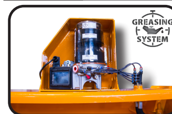
▶ Engrase centralizado